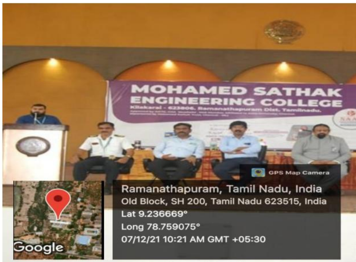
Dignitaries on the Dias for Carrier Guidance Programme