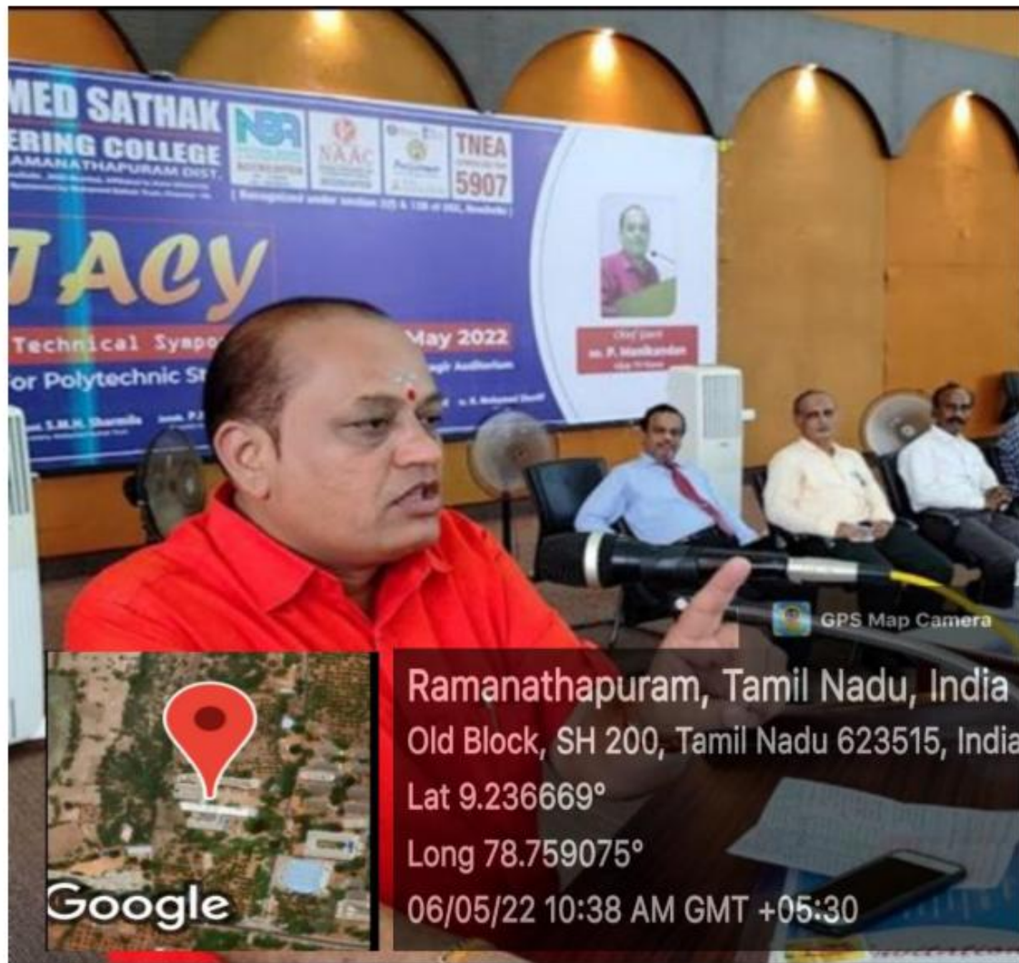
Chief Guest addressing the gathering of State Level Technical Symposium for Polytechnic students (Ecstasy 1.0)

iii) Under Carrier guidance programme MSEC organized one day State Level Technical Symposium for Arts and Science College students conducted on 25.05.2022 in Dasthahir Auditorium.