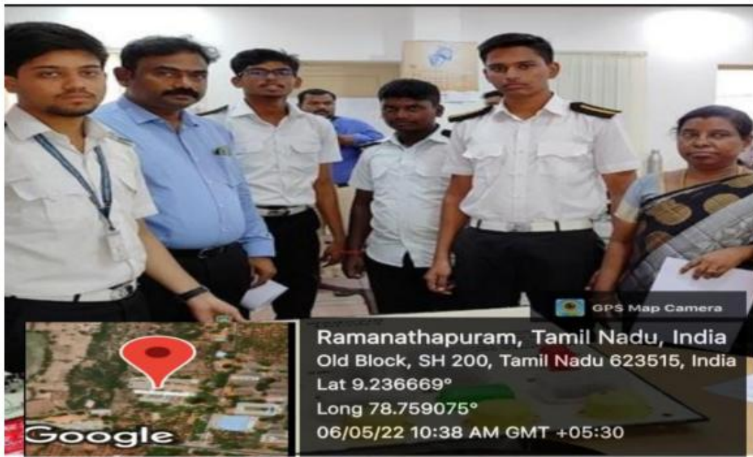
Students showing their project model on “Project Expo 2022”

Under Carrier guidance programme MSEC organized “Project Expo 2022” for Polytechnic students and selected best projects were awarded certificate with Cash Prize.