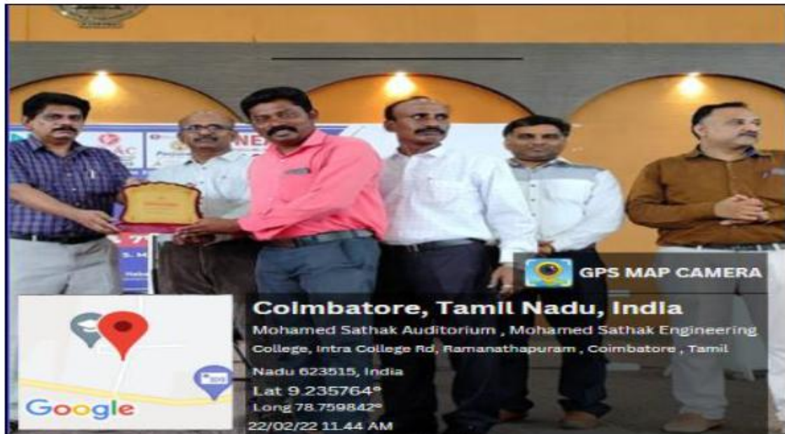
Best Teacher Award recipient

vi) Under Carrier guidance programme MSEC jury panel members selected teachers for “Best Teacher Award” from school teacher for their achievement.