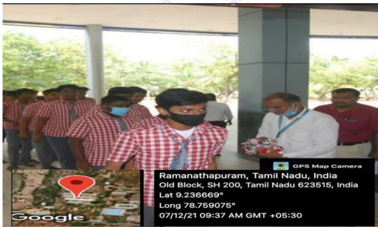
School students entered inside the Auditorium